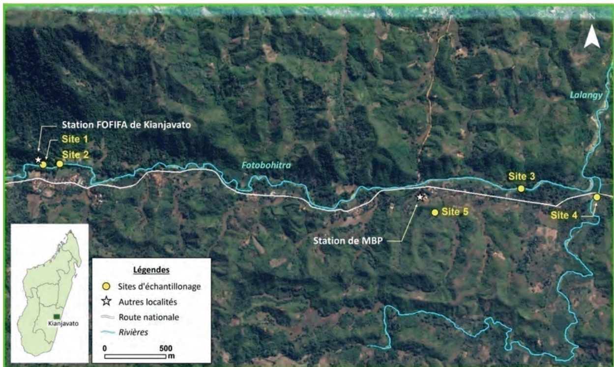
Figure 1. Localisation dans la région de Kianjavato et des sites de capture des chauves-souris et arthropodes avec pièges Malaise (= sites d'échantillonnage). MBP : « Madagascar Biodiversity Partnership ».

Afin de déterminer la distribution et l'abondance des proies disponibles, deux pièges Malaise (« Slam trap », Meg View Science, Taiwan) ont été installés à proximité des filets. Un a été installé au sol et l'autre à environ 2 m au-dessus du premier piège. Cette